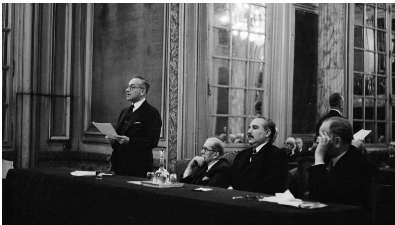
Vyslanec Štefan Osuský