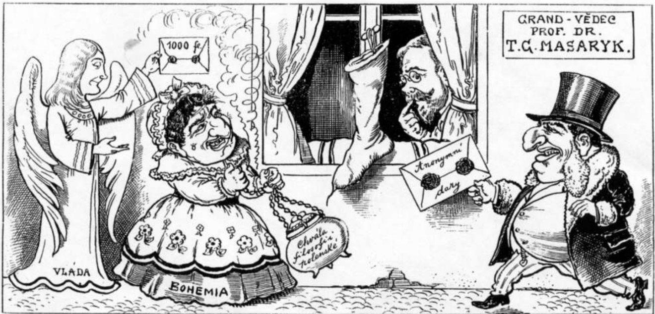
Karikatúra T. G. Masaryka počas Hilsneriády