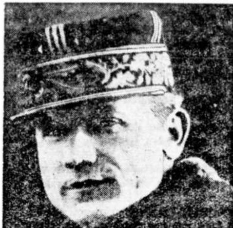
Štefánik v ľudáckej tlači

Tohto týždňa, zasväteného pietnej spomienke tragickej smrti generála dr. M. R. Štefánika, v mohutnej bohatosti oživila pred nami legendárna postava tohto národného hrdinu slovenského, pre ktorého nebolo nemožností. Toto 20. výročie štvrtomájovej tragédie prvý raz nám predstavilo M. R. Štefánika, snivého bádateľa nadoblačných svetov i neohrozeného vojaka, v obdivuhodnej kráse ideálnosti. Áno, legendárna postava dr. M. R. Štefánika je a má byť ideálom pre nás všetkých Slovákov. Ale má byť vzorom predovšetkým nám, gardistom, ktorí cheme byť príkladom pre ostat-