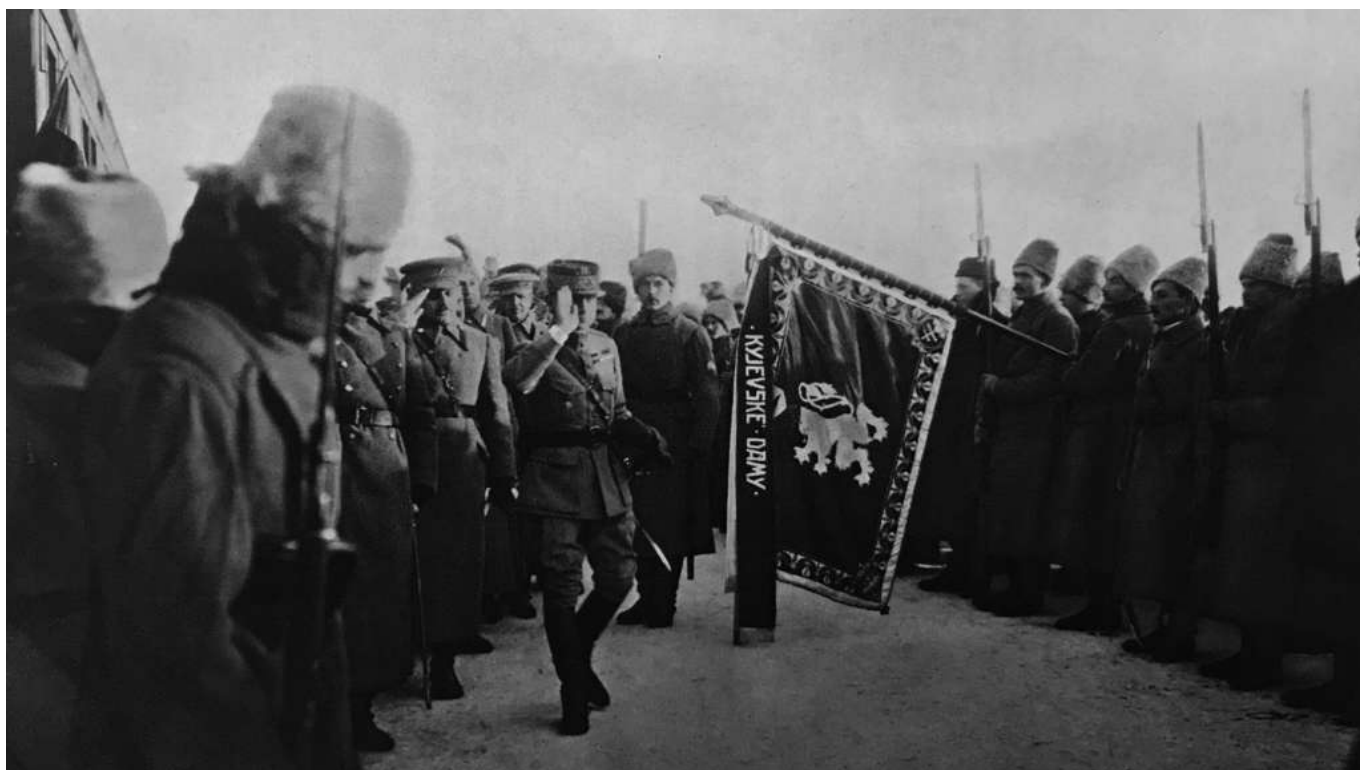
Štefánik v Jekaterinburgu