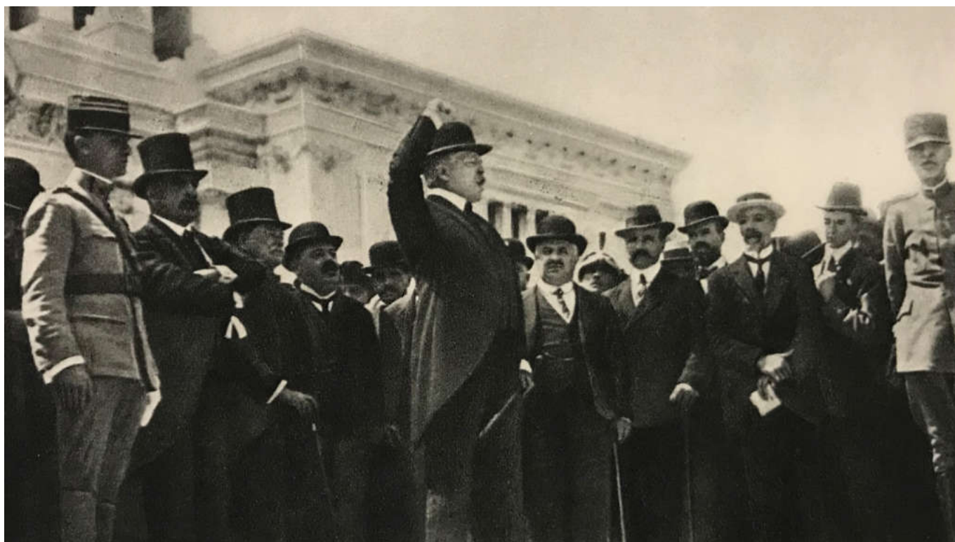
Štefánik počas odovzdávania zástavy čs. vojsku v Taliansku